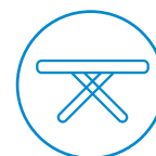
Tafel (of kniematje)